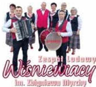
Zespół Ludowy Wiśniewiaczy im. Zbigniewa Myrchy