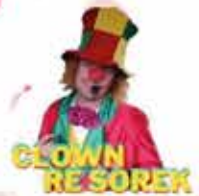
CLOWN RE SOREK