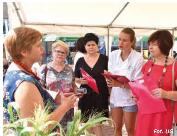
Komisja konkursowa w trakcie obrad