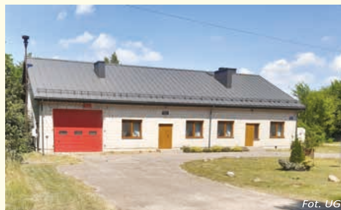
Strażnica w Śmiarach – stan obecny.