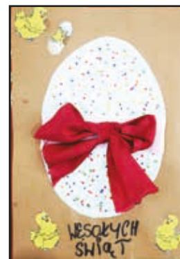
III Miejsce Kamil Bednarczyk (Radomyśl)