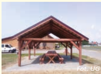
Wiata w Mroczkach

Przedmiotowe zadanie zrealizowano w lipcu br. a polegało na wykonaniu ogólnodostępnej wiaty turystycznej z elementami małej infrastruktury tj. ławki, stół, stojaki rowerowe, grill, kosz na śmieci, tablica informacyjno-promocyjna, która będzie miejscem wypoczynku dla turystów i lokalnej społeczności a także będzie pełniła funkcję promocyjno-informacyjną Gminy Wiśniew oraz obszaru Lokalnej Grupy Działania Ziemi Siedleckiej.