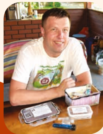
Waldemar Zielonka

*GOECACHING (gr. geo – Ziemia, ang. cache – chować, skrytka, schowek, kryjówka) – gra terenowa użytkowników odbiorników GPS, polegająca na poszukiwaniu tzw. skrytek (ang. geocache) uprzednio ukrytych przez innych uczestników zabawy. Ukrywane przeważnie w interesujących miejscach skrytki zawierają dziennik odwiedzin, do którego wpisują się kolejni znalazcy, a także drobne upominki na wymianę. Lokalizacja miejsca ukrycia skrytki przekazywana jest przez jej założyciela innym uczestnikom gry poprzez wprowadzenie współrzędnych geograficznych w jednej ze specjalnych internetowych baz danych, tzw. serwisów geocachingowych. Źródło: Wikipedia, przyp. red.