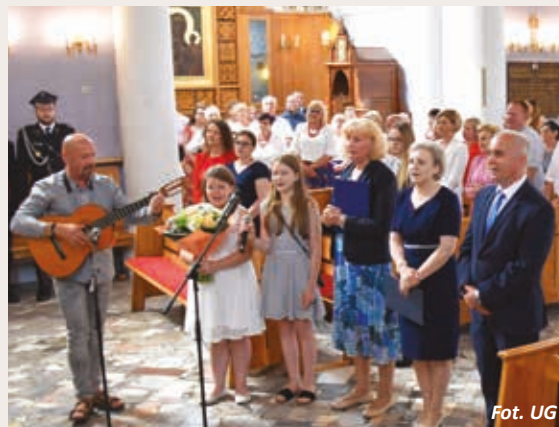
Przedstawiciele Zespołu Oświatowego w Wiśniewie