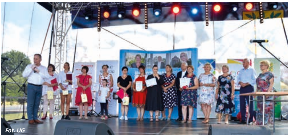
Laureaci i uczestnicy konkursu kulinarnego na festiwalowe potrawy z wiśni