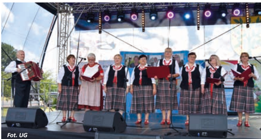
Fot. UG Zespół Ludowy im. Zbigniewa Myrchy „Wiśniowiacy”