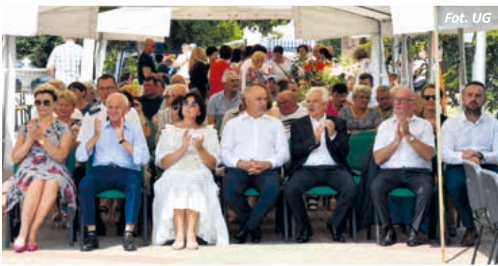
Goście zaproszeni na XIII Festiwal Kuchni Regionalnej „Z wiśniowym smakiem”