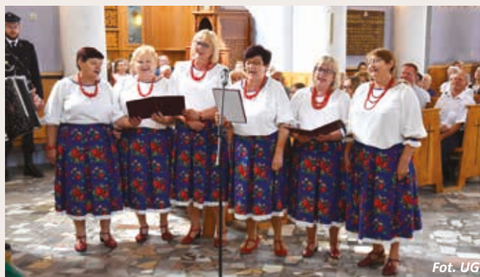
Zespół Ludowy im. Zbigniewa Myrchy „Wiśniewiaczy”