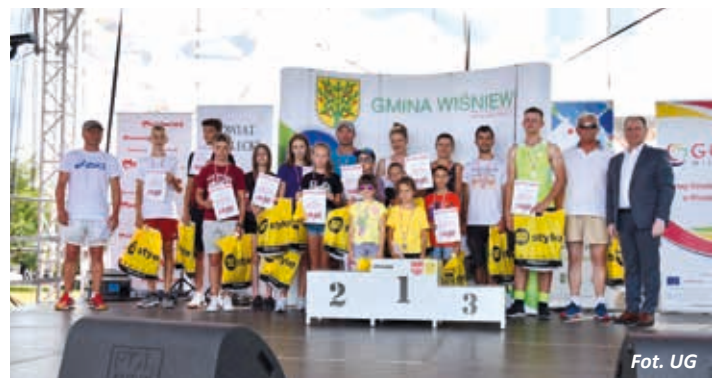
Laureaci VIII Biegu Ulicznego „Z wiśniową w tle”