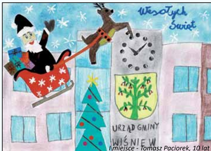
I miejsce - Tomasz Paciorek, 10 lat

Poniżej i na stronie obok przedstawiamy państwu galeria nadesłanych projektów kart świątecznych.