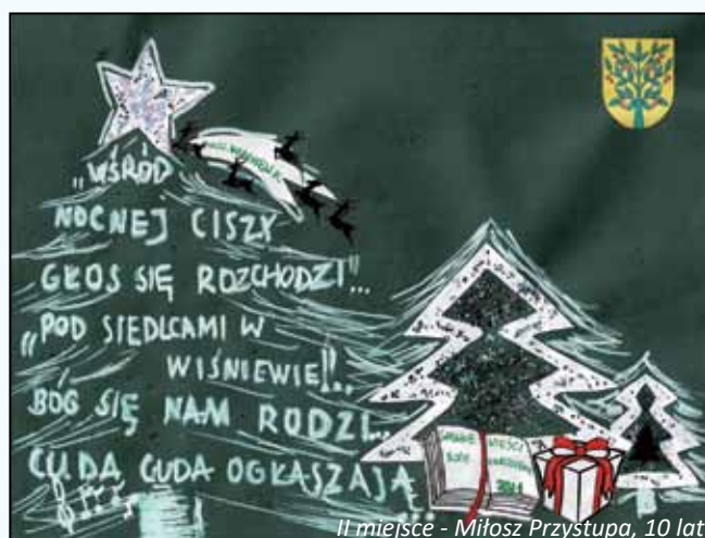
II miejsce - Miłosz Przystupa, 10 lat