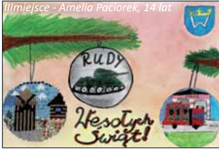
III miejsce - Amelia Paciorek, 14 lat