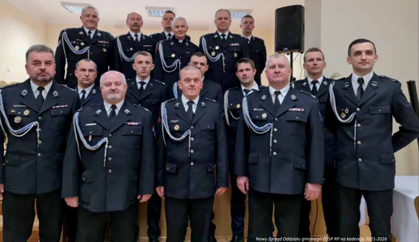
Nowy Zarząd Oddziału gminnego ZOSP RP na kadencję 2021-2026