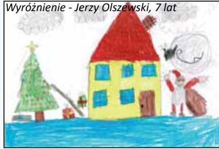
Wyróżnienie - Jerzy Olszewski, 7 lat