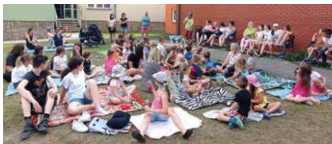
Szkoła Podstawowa w Śmiarach